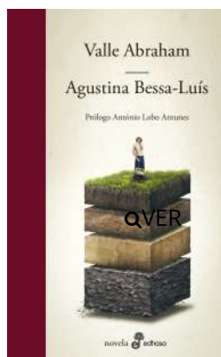
Valle Abraham Agustina Bessa-Luís $28.000