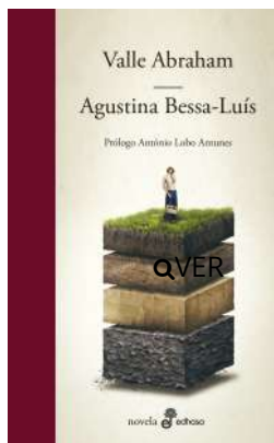
Valle Abraham Agustina Bessa-Luís $28.000