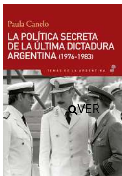
La política secreta de