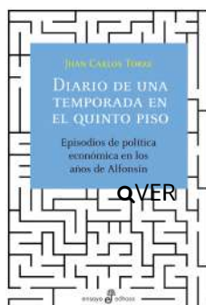
Diario de una