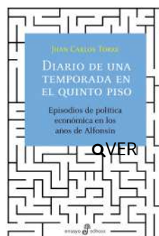
Diario de una