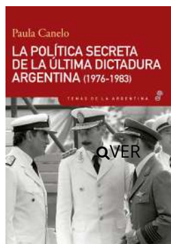
La política secreta de