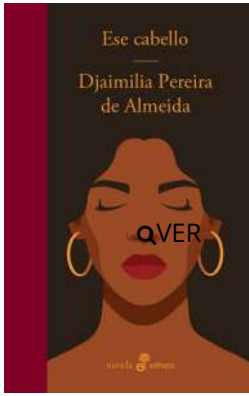
Ese cabello Djaimilia Pereira de Almeida $21.000