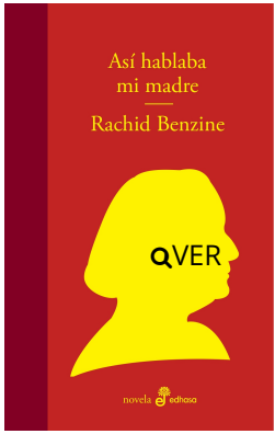
Así hablaba mi madre Rachid Benzine $21.000