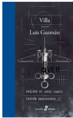
Villa Luis Gusmán $23.000

Los muertos no mienten Luis Gusmán $21.000