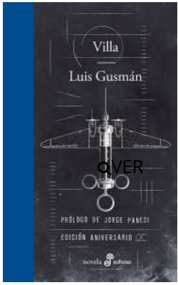
Villa Luis Gusmán $23.000