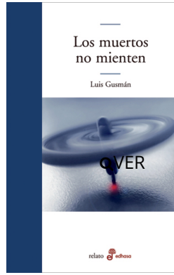
Los muertos no mienten Luis Gusmán $21.000