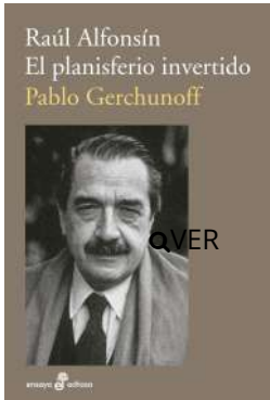
Raúl Alfonsín Pablo Gerchunoff $38.000