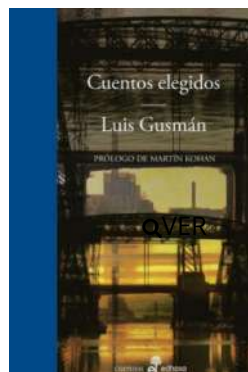
Cuentos elegidos Luis Gusmán $23.000