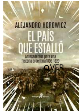
El país que estalló Alejandro Horowicz $37.000