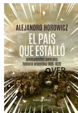
El país que estalló Alejandro Horowicz $49.900