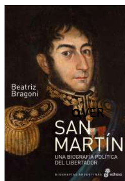
San Martín Beatriz Bragoni $41.500