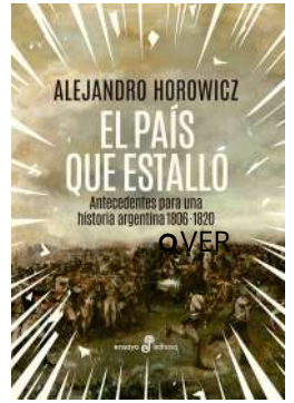
El país que estalló Alejandro Horowicz $37.000