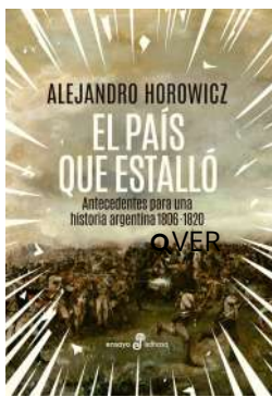
El país que estalló Alejandro Horowicz $49.900