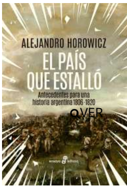
El país que estalló Alejandro Horowicz $37.000