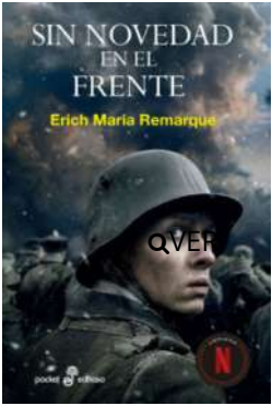
Sin novedad en el frente Erich Maria Remarque $23.000