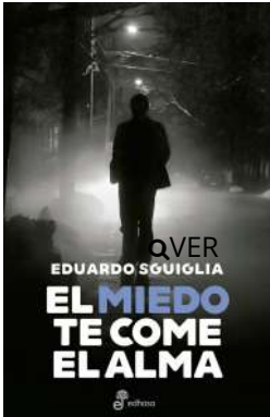
El miedo te come el alma Eduardo Sguiglia $23.000