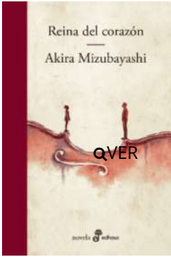
Reina del corazón Akira Mizubayashi $25.000