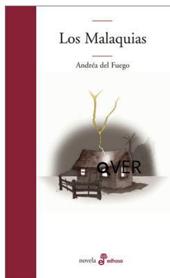
Los Malaquias Andréa Del Fuego $21.000