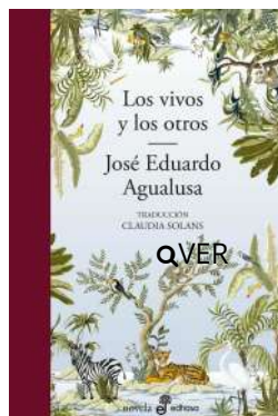
Los vivos y los otros José Eduardo Agualusa $21.000