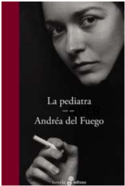
La peditra Andréa Del Fuego $16.500