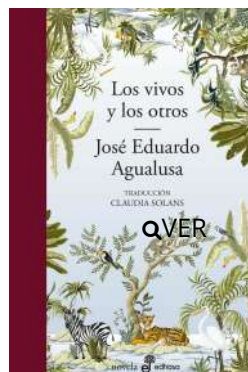
Los vivos y los otros José Eduardo Agualusa $21.000