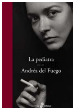
La peditra Andréa Del Fuego $34.900