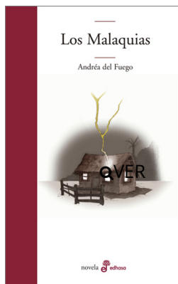
Los Malaquias Andréa Del Fuego $21.000