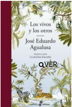
Los vivos y los otros José Eduardo Agualusa $16.500