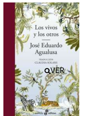
Los vivos y los otros José Eduardo Agualusa $31.900