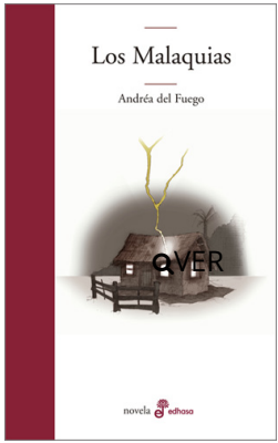
Los Malaquias Andréa Del Fuego $16.500