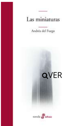
Las miniaturas Andréa Del Fuego $21.000