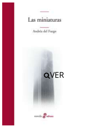
Las miniaturas Andréa Del Fuego $31.900