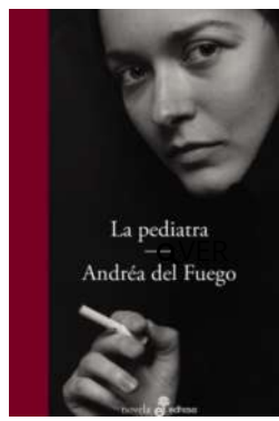
La peditra Andréa Del Fuego $34.900