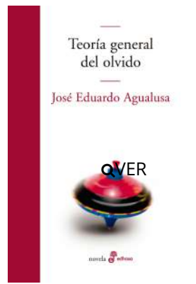
Teoría general del olvido José Eduardo Agualusa $34.900