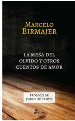
La mesa del olvido y otros cuentos de amor Marcelo Birmajer $21.000