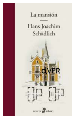
La mansión Hans Joachim Schädlich $21.000