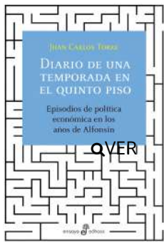
Diario de una temporada en el quinto piso Juan Carlos Torre $40.000