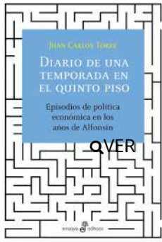
Diario de una temporada en el quinto piso Juan Carlos Torre $52.500