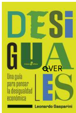
Desiguales Leonardo Gasparini $24.000