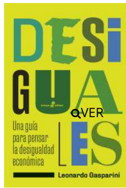
Desiguales Leonardo Gasparini $32.000