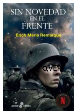
Sin novedad en el frente Erich Maria Remarque $23.000