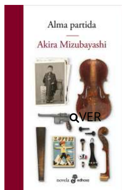
Alma partida Akira Mizubayashi $25.000