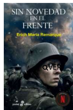
Sin novedad en el frente Erich Maria Remarque $14.500