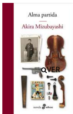
Alma partida Akira Mizubayashi $25.000