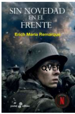
Sin novedad en el frente Erich Maria Remarque $34.900