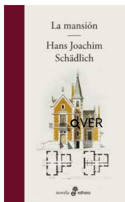
La mansión Hans Joachim Schädlich $21.000