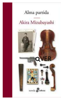
Alma partida Akira Mizubayashi $17.500