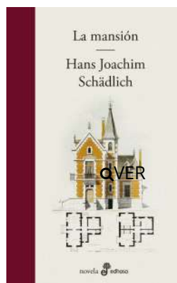
La mansión Hans Joachim Schädlich $16.500