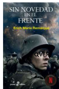
Sin novedad en el frente Erich Maria Remarque $23.000