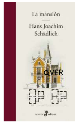
La mansión Hans Joachim Schädlich $31.900