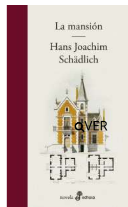
La mansión Hans Joachim Schädlich $21.000