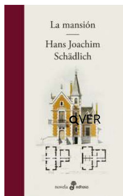
La mansión Hans Joachim Schädlich $21.000