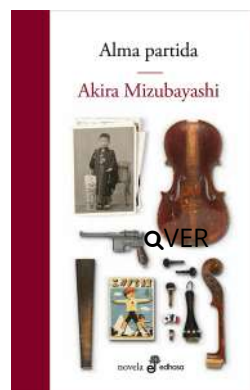
Alma partida Akira Mizubayashi $25.000