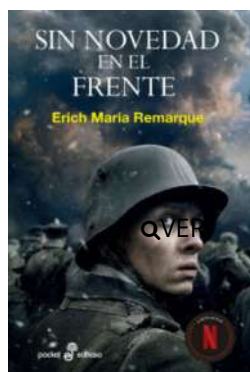
Sin novedad en el frente Erich Maria Remarque $23.000